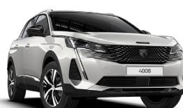
Белый перламутр BLANC NACRÉ