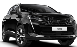
Черный NOIR PERLA NERA