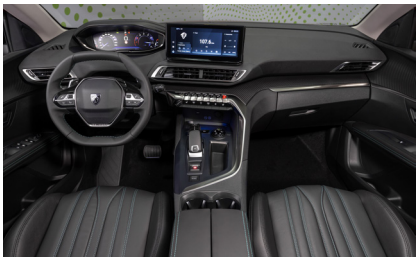
Кожа CLAUDIA / 8YFQ