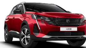
Красный ROUGE ELIXIR