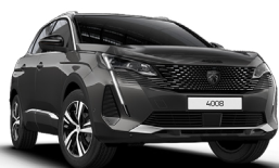
Серый GRIS PLATINUM